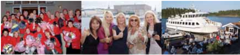
Мероприятия для топ-Лидеров